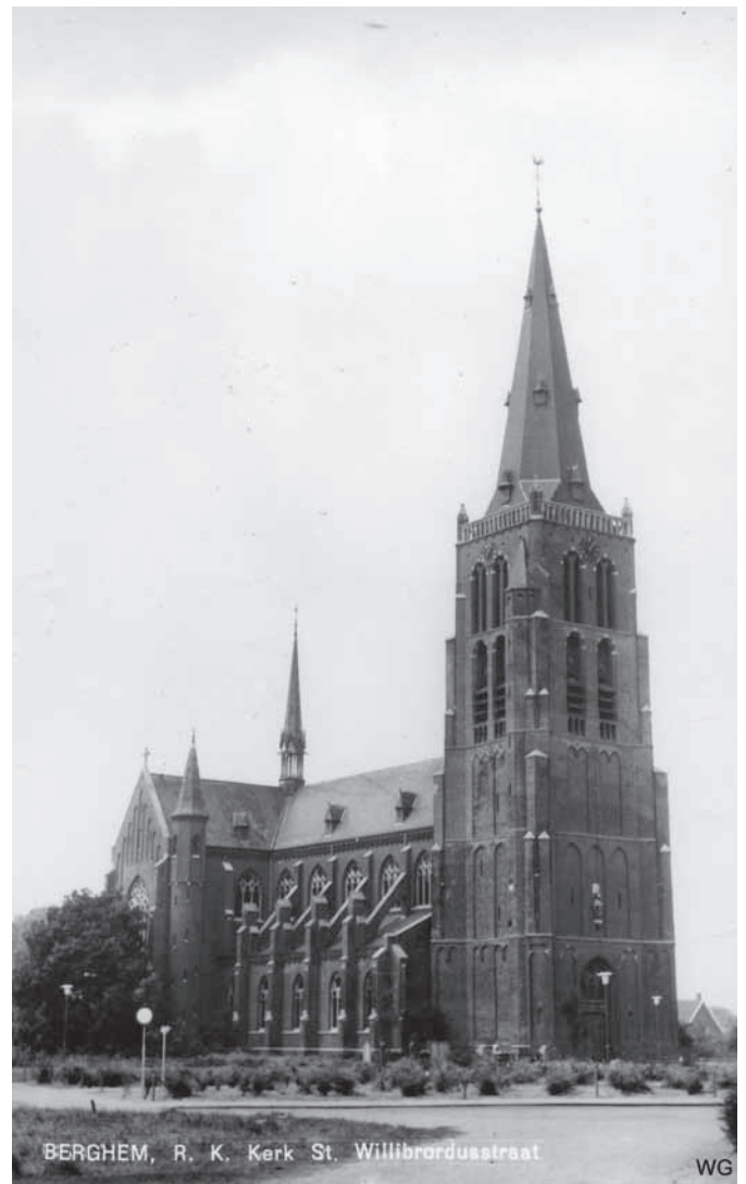
BERGHEM, R. K. Kerk St. Willibrordusstraat

De dialoog, over rooms katholieken, protestanten en moslimgemeenschap heen, is van grote waarde. De samenwerking, los van het geloof, is de grootste stap voorwaarts. Zo'n dialoog vereist een zekere ruimhartigheid; openstelling voor andermans opvattingen en ideeën en de acceptatie gebonden te zijn aan wat uit die samenwerking groeit. Vrijwel zeker zal religieus erfgoed en kerkensie nogal eens onderwerp van gesprek zijn. En mocht beweerd worden, dat er hier of daar iets gaat verdwijnen schrik dan niet te hard en laat je niets wijs maken. In de pilot zal niemand in zijn eentje dingen kunnen beslissen of vetorecht hebben. We mogen ons gelukkig prijzen met een goede vertegenwoordiger daarin, bij wie behartiging van onze belangen in goede, ja in prima handen is.